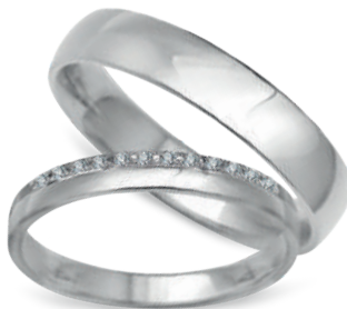
model 551W*, szerokość 3,5mm model 551WK**, szerokość 2,5mm

Złoto próby 0,585. *Dostępne również w próbie 0,333. **Model z cyrkoniami, istnieje możliwość osadzenia diamentów.