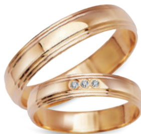
model 931, szerokość 4mm model 931K*, szerokość 4mm