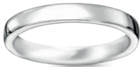
model 834W szerokość 3 mm