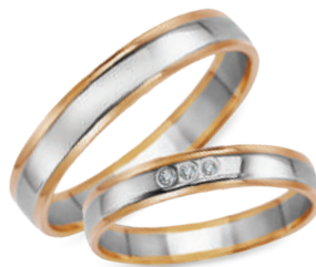
model 930, szerokość 3,5mm model 930K*, szerokość 3,5mm

Złoto próby 0,585. *Model z cyrkoniami, istnieje możliwość osadzenia diamentów.