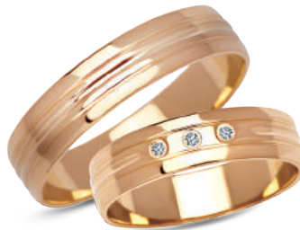
model 906, szerokość 5mm model 906K*, szerokość 5mm