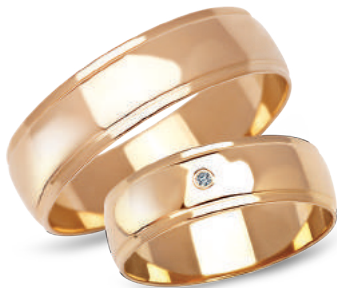
model 901, szerokość 6mm model 901K*, szerokość 6mm