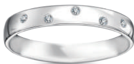
model 566 WD szerokość 3 mm 5 diamentów 0,01 ct