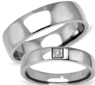
model 629, szerokość 6mm model 629K*, szerokość 4mm

Tytan. *Model z cyrkoniami. **Tytan, złoto próby 0,750. Modele obrączek tytanowych dostępne są do rozmiaru 69 włącznie.