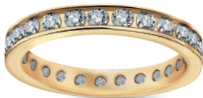
model 834 D szerokość 3 mm 25 diamentów 0,05 ct