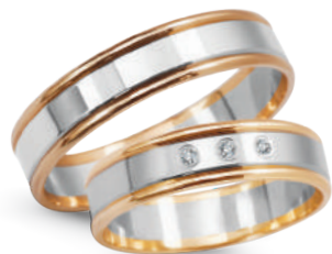
model 928, szerokość 5mm model 928K*, szerokość 5mm