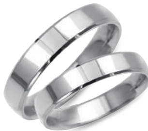
model 927W/4, szerokość 4,5mm