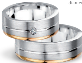
Rumba szerokość 6mm, obrączka damska diament 0,05ct