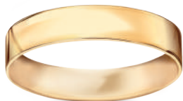
model 567 szerokość 4,5 mm