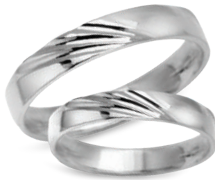
model 934W, szerokość 3,5mm