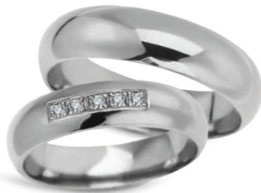
model 631, szerokość 6mm model 631K*, szerokość 5mm