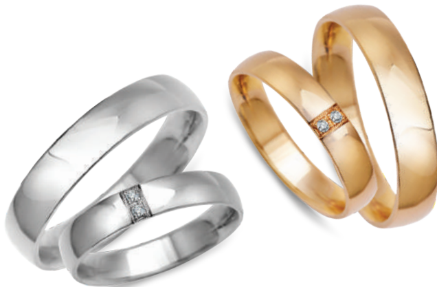
model 702*, szerokość 4mm model 452WK**, szerokość 4mm