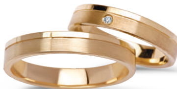
model 269K*, szerokość 4mm diament 0,02ct model 269*, szerokość 4mm

Złoto próby 0,585. *Dostępne również w próbie 0,333.