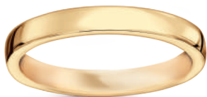
model 834 szerokość 3 mm