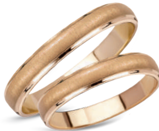
model 511, szerokość 3mm