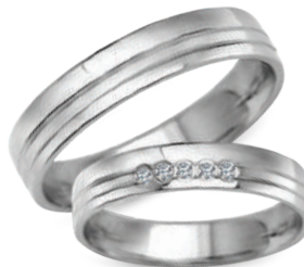
model 932W, szerokość 4mm model 932WK**, szerokość 4mm

Złoto próby 0,585. *Dostępne również w próbie 0,333. **Model z cyrkoniami, istnieje możliwość osadzenia diamentów.