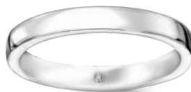
model 834 WD1 szerokość 3 mm diament 0,01 ct

Stwórz swoją idealną parę! Dowolnie łącz obrączki z kolekcji Forever.