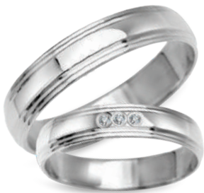
model 931W, szerokość 4mm model 931WK*, szerokość 4mm