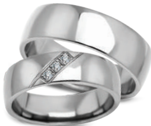
model 627, szerokość 7mm model 627K*, szerokość 6mm