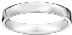
model 568 W szerokość 3,5 mm