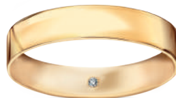
model 567 D1 szerokość 4,5 mm 1 diament 0,01 ct