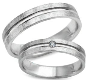
model 550W*, szerokość 4mm model 550WK**, szerokość 4mm