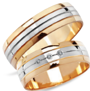
model 919, szerokość 5mm model 919K*, szerokość 5mm

Złoto próby 0,585. *Model z cyrkoniami, istnieje możliwość osadzenia diamentów.