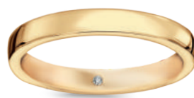
model 834 D1 szerokość 3 mm diament 0,01 ct