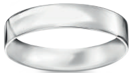
model 567W szerokość 4,5 mm