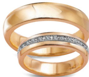
Boogie szerokość 4,5mm, obrączka damska 15 diamentów o łącznej masie 0,15ct