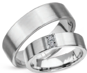
☉ model 601, szerokość 6mm model 619K*, szerokość 5mm