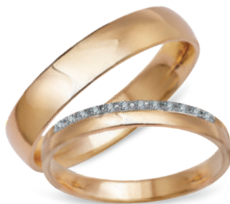
model 551*, szerokość 3,5mm model 551K**, szerokość 2,5mm