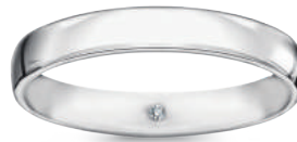
model 566 WD1 szerokość 3,5 mm 1 diament 0,01 ct