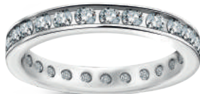
model 834 WD szerokość 3 mm 25 diamentów 0,05 ct