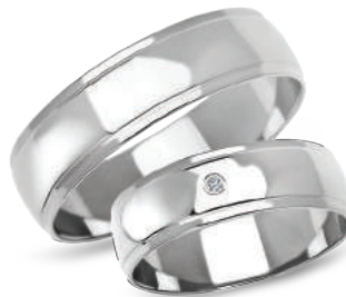
model 901W, szerokość 6mm model 901WK*, szerokość 6mm

Złoto próby 0,585. *Model z cyrkoniami, istnieje możliwość osadzenia diamentów.