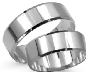
model 927W, szerokość 7mm