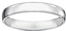
model 566 W szerokość 3,5 mm