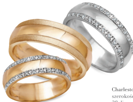
Charleston szerokość 6mm, obrączka damska 28 diamentów o łącznej masie 0,28ct