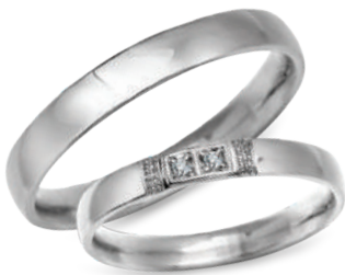
model 702*, szerokość 3mm model 453WK**, szerokość 3mm