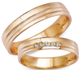
model 932, szerokość 4mm model 932K**, szerokość 4mm