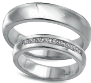
model 830W, szerokość 4,5mm model 830WK/1*, szerokość 4,5mm