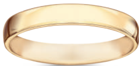
model 566 szerokość 3,5 mm