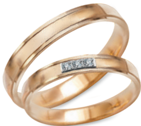
model 552*, szerokość 3,5mm model 552K*, **, szerokość 2,5mm