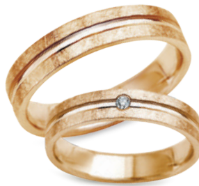
model 550*, szerokość 4mm model 550K**, szerokość 4mm