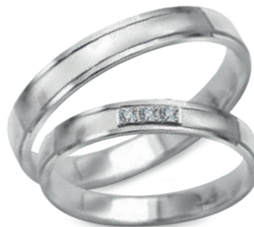
model 552W*, szerokość 3,5mm model 552WK*, **, szerokość 2,5mm

Złoto próby 0,585. *Dostępne również w próbie 0,333. **Model z cyrkoniami, istnieje możliwość osadzenia diamentów.