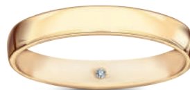
model 566 D1 szerokość 3,5 mm 1 diament 0,01 ct

Złoto próby 0,585, 0,750, diamenty. Aktualne ceny: YES.pl/Forever