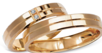
model 267K*, szerokość 4mm 2 diamenty o łącznej masie 0,02ct model 267*, szerokość 4mm

Złoto próby 0,585.*Dostępne również w próbie 0,333.**Model z cyrkoniami, istnieje możliwość osadzenia diamentów.