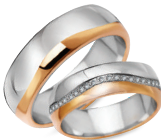
Foxtrot szerokość 6mm, obrączka damska 48 diamentów o łącznej masie 0,24ct