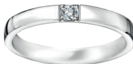
model 568 WD szerokość 2,7 mm diament 0,05 ct