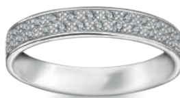
model 567 WD szerokość 3,2 mm 36 diamentów 0,01 ct