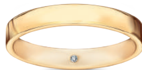
model 568D1 szerokość 3,5 mm diament 0,01 ct