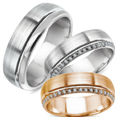
Boston szerokość 6mm, obrączka damska 20 diamentów o łącznej masie 0,1ct