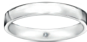
model 568 WD1 szerokość 3,5 mm diament 0,01 ct

Złoto próby 0,585, 0,750, diamenty. Aktualne ceny: YES.pl/Forever