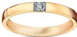
model 568D szerokość 2,7 mm diament 0,05 ct