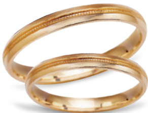
model 451*, szerokość 2,5mm lub 3,5mm