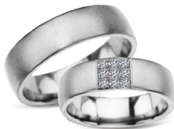
model 624, szerokość 6mm model 624K*, szerokość 6mm