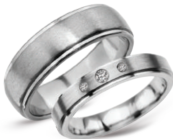
☞ model 611, szerokość 7mm model 620K*, szerokość 4mm

Tytan. *Model z cyrkoniami. Modele obrączek tytanowych dostępne są do rozmiaru 69 włącznie.