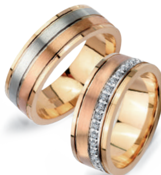
Salsa szerokość 7mm, obrączka damska 40 diamentów o łącznej masie 0,28ct