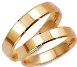
model 927/4, szerokość 4,5mm