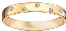
model 566 D szerokość 3 mm 5 diamentów 0,01 ct