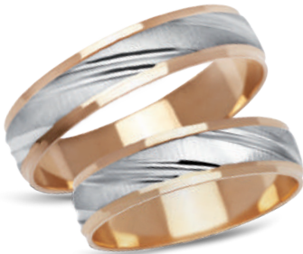
model 903, szerokość 5mm