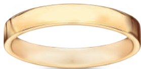
model 568 szerokość 3,5 mm