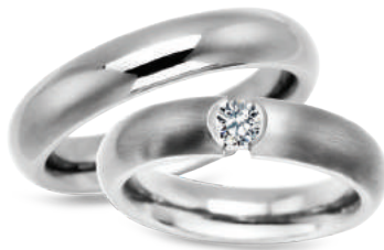
model 625, szerokość 5mm model 625K*, szerokość 5mm

Tytan.*Model z cyrkoniami. Jakość każdego diamentu jest poświadczona Certyfikatem YES.