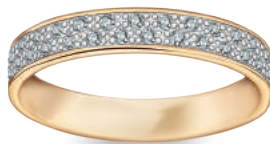
model 567 D szerokość 3,2 mm 36 diamentów 0,01 ct