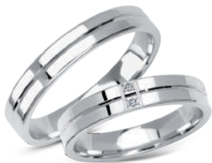
model 267W, szerokość 4mm model 267WK, szerokość 4mm 2 diamenty o łącznej masie 0,02ct