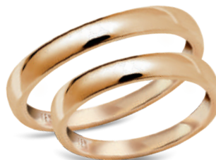
model 733*, szerokość 3mm

Złoto próby 0,585. *Dostępne również w próbie 0,333. **Model z cyrkoniami, istnieje możliwość osadzenia diamentów.