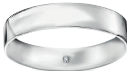
model 567 WD1 szerokość 4,5 mm 1 diament 0,01 ct

Złoto próby 0,585, 0,750, diamenty. Aktualne ceny: YES.pl/Forever