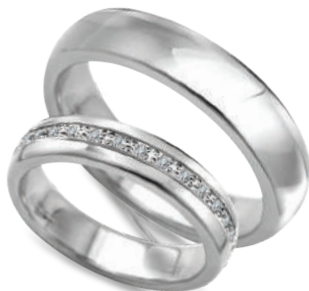
Boogie szerokość 4,5mm, obrączka damska 15 diamentów o łącznej masie 0,15ct